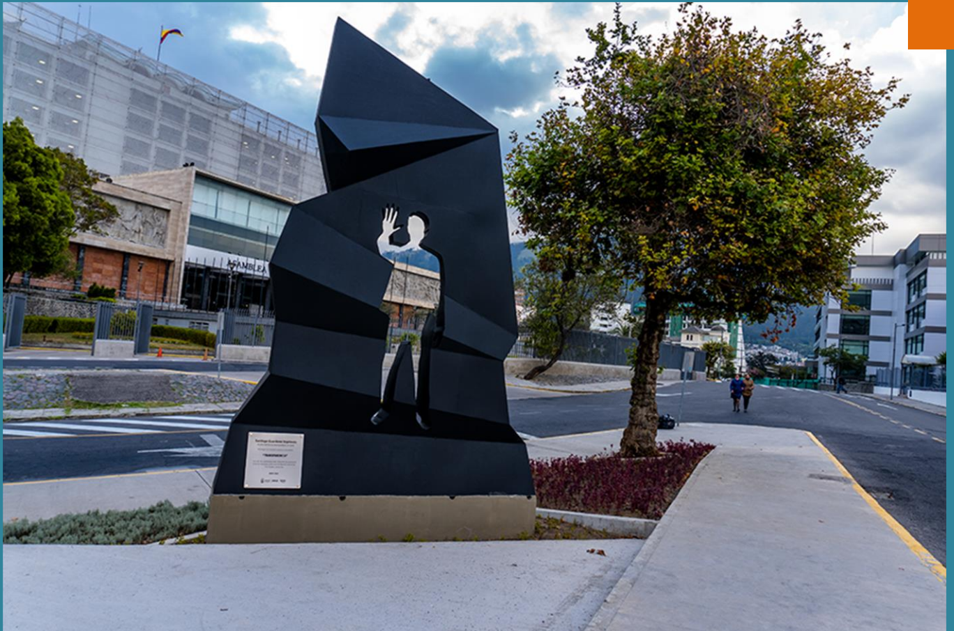
Monumento a la Transparencia, del escultor Fernando Rivera Salvador inaugurado en Quito en agosto de 2022, en el marco del Congreso Internacional Anticorrupción.